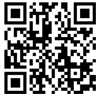
교육 신청 홈페이지 (edu.korsta.or.kr)